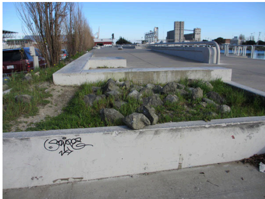
Ett känt torg i San Francisco med lite olika kanter.